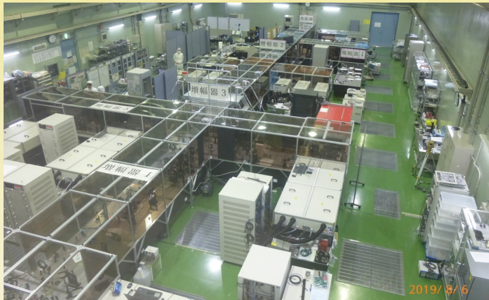
利用可能な施設例：J-KAREN（高強度超短パルスレーザー装置：木津地区実験棟） その他、X線レーザー実験装置、kHzチタンサファイアレーザー、QUADRA-Tレーザーシステム等

QST関西光科学研究所の施設利用に関わる研究課題は年2回、一般産業利用や一部施設については随時、外部利用を募集しております。御要望により成果公開・非公開の選択や、QSTの研究員による支援の依頼も可能です。